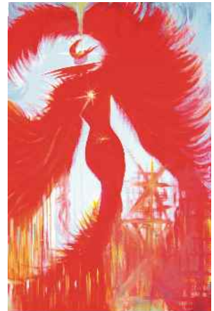
“Le Féminin”, 2008