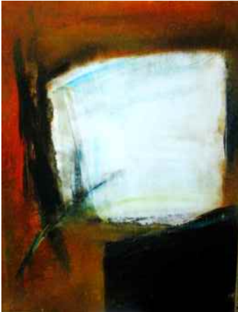
“Toi et Toi”