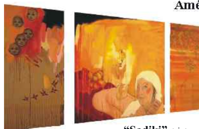
“Sadiki”, triptyque huile sur toile, 80x40, 80x80, 80x40cm

Alias Am* de Paris est une contemplative active. Voyageuse dans l'âme, elle n'a eu de cesse de visiter d'autres univers artistiques. Elle a participé à diverses expositions. Infographiste et observatrice des ondes sonores et colorées, elle est aussi musicienne et poétesse en herbe, elle puise son inspiration à la source sacrée des êtres dans tous leurs états.